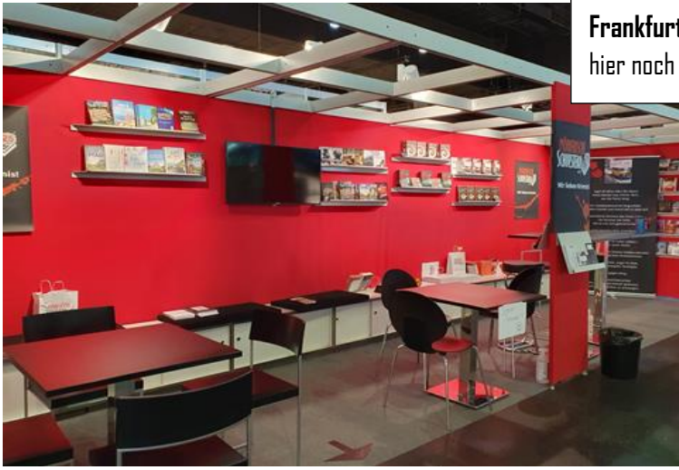
Frankfurter Buchmesse Oktober 2021 – Auch wenn man es hier noch nicht sieht – unser Messestand war heiß umschwärmt.