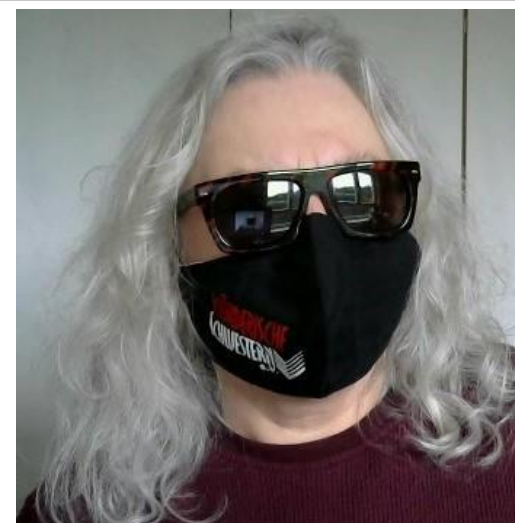
Inzwischen nur noch als Aufhübscher für medizinischen Mund-Nasen-Schutz – unsere Mörderische Schwestern-Maske .